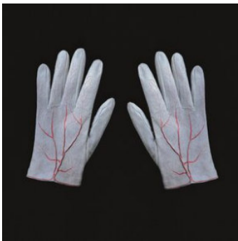
Meret Oppenheim Glove | 1985 | Ziegenwildleder (handgenäht) und Serigrafie | 25,5 x 21 x 2 cm | Für Parkett 4 Taxe: € 2.000 – 4.000