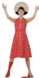
Pipilotti Rist The Help | 2004 | Textil-Cutout und 14 Stecknadeln 178 x 110 x 0,1 cm | Für Parkett 71 Taxe: € 1.000 – 2.000