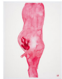
Louise Bourgeois The Maternal Man | 2008 | Archival dyes auf Stoff | 26 x 20,5 cm | Für Parkett 82 Taxe: € 3.000 – 6.000