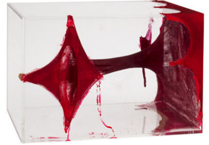
Anish Kapoor Ohne Titel | 2003 | Plexiglas und Strumpf, handkoloriert | 26 x 26 x 38 cm | Für Parkett 69 Taxe: € 3.000 – 5.000