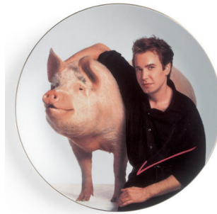
Jeff Koons Signature Plate | 1989 | Porzellan 27,5 x 27,5 x 3,5 cm | Für Parkett 19 Taxe: € 500 – 1.000