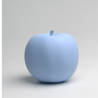
Katharina Fritsch Apfel | 2009/2010 | Kunstharz, farbig gefasst 13 x 14 x 14 cm | Für Parkett 87 Taxe: € 10.000 – 15.000