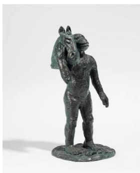
Jörg Immendorff Malerstamm Blinky Bronze, grün patiniert | 33 x 16,5 x 17cm Schätzpreis: 8.000 – 12.000 Euro