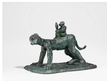
Jörg Immendorff Malerstamm Georg und Otto Bronze, grün patiniert | 21 x 31 x 21cm Schätzpreis: 4.000 – 6.000 Euro

Digitale Abbildungen stellen wir Ihnen selbstverständlich gerne zur Verfügung.