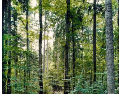
Thomas Struth Paradise 19 (Bayrischer Wald bei Zwiesel) | 1999 C-Print auf Diasec | 169,5 x 213,1cm Schätzpreis: 50.000 – 60.000 Euro