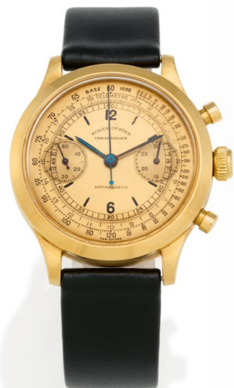
OBEN ROLEX Chronograph Ref. 3525 Taxe: € 60.000 – 90.000