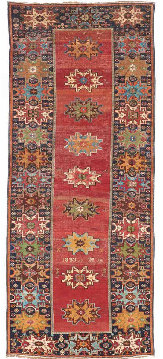
Kuba, armenisch. Dat. 1893 | 367 × 151cm Taxe: € 2.400