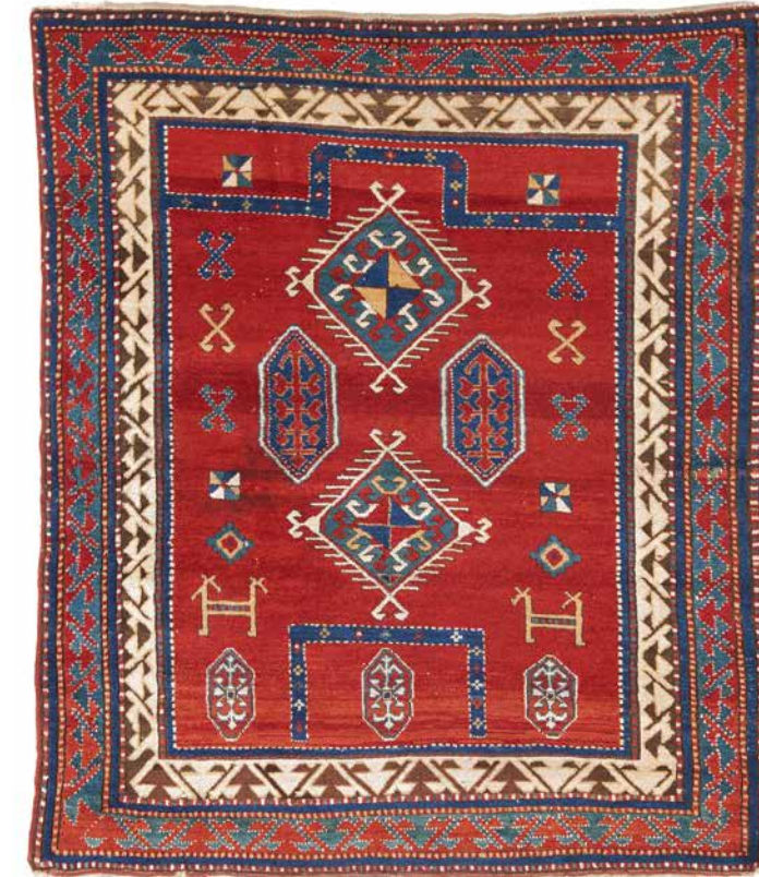
Kasak-Bordjalu. 19. Jh. | 149 × 127cm Taxe: € 2.500