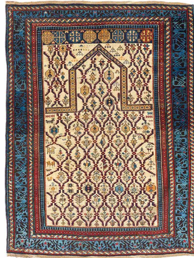
Kaukasischer Knüpftteppich, Region Kuba. Mitte 19. Jh. | 180 × 139cm Vgl. Schürmann, Teppiche aus dem Kaukasus, S. 262/263 Taxe: € 4.000