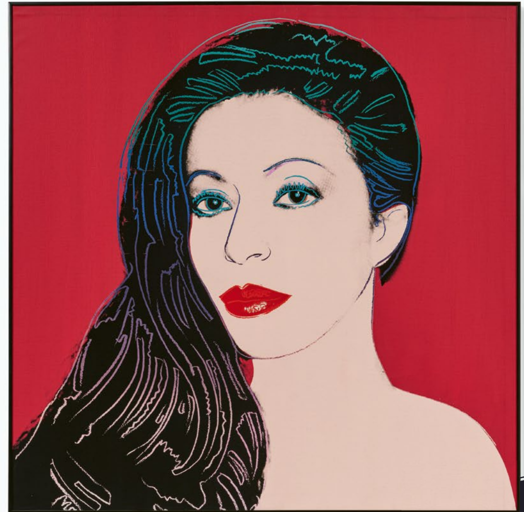
ANDY WARHOL (1928–1987) Beautiful Lady | 1984 | Acryl auf Leinwand | 101×101cm Taxe: € 300.000–500.000