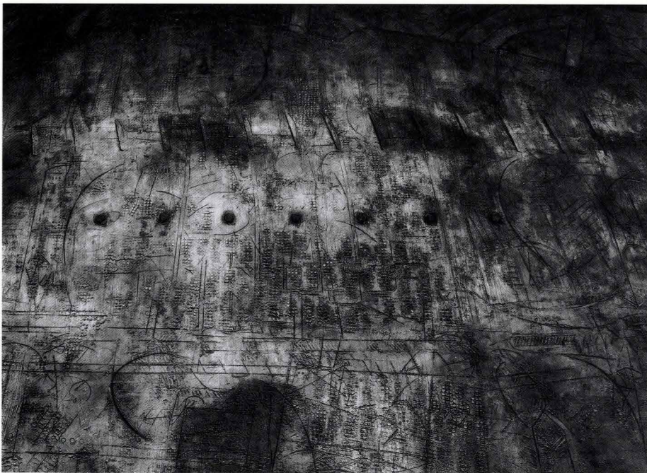
Detail zu 001.66 - B 0410