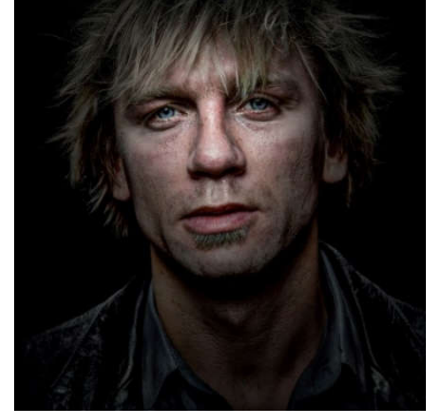
Gavin Evans (1964) The Daniel Craig Godpixel Created 2021 Source photographs taken in London, UK, December 1999 Schätzpreis: € 10.000 – 15.000