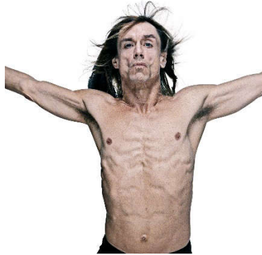
Gavin Evans (1964) The Iggy Pop Godpixel Created 2021 Source photographs taken in New York, USA. 1998 Schätzpreis: € 10.000 – 15.000