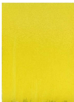
Joseph Marioni (1943) "Yellow Painting" | 1996 Acryl auf Leinwand | 270 x 200cm Ergebnis: 77.400 Euro*

*Int. Auktionsrekord für diesen Künstler