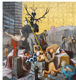
Jonas Burgert (1969) Selbstjäger | 2005 | Öl und Goldfarben auf Leinwand | 300 x 280 cm Ergebnis: 116.100 Euro

*Int. Auktionsrekord für diese Künstlerin