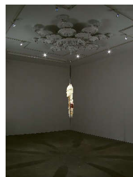
Barry X Ball (1955) The akra tapeinosis (...) - Portrait Matthey Barney. Rauminstallation 2000 – 2004 | Mixed Media Installationsmaß: Ca. 320 x 350 x 350 cm Ergebnis: 180.600 Euro*

*Int. Auktionsrekord für diesen Künstler