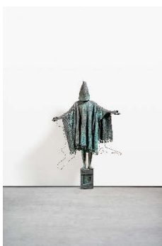
Marc Quinn (1964) Mirage | 2009 | Bronze, grün-schwarz patiniert | 233 x 147 x 50 cm Ergebnis: 90.300 Euro