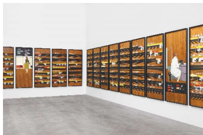
Andrea Zittel (1965) Free Running Rhythms and Patterns Version II. Installation von 28 Holzpaneelen | 2000. Mixed Media | Jeweils: 201 x 80 x 5cm Ergebnis: 141.900 Euro*

*Int. Auktionsrekord für diese Künstlerin