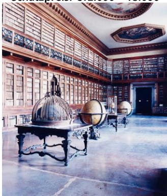
Candida Höfer (1944) "Biblioteca Seminario Patriarcale Venezia III" | 2003 | C-Print | Ex. 2/6 175 x 152cm Schätzpreis: €15.000 – 20.000