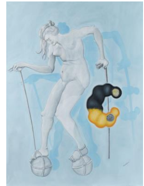
Jörg Immendorff (1945 – 2007) Ohne Titel | 2000 | Öl auf Leinwand 280 x 210cm Schätzpreis: €20.000 – 30.000