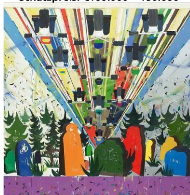
Tal R (1967) „Riders in the sky“ | 2001/02 Öl auf Leinwand | 250 x 250 cm Schätzpreis: €25.000 – 35.000