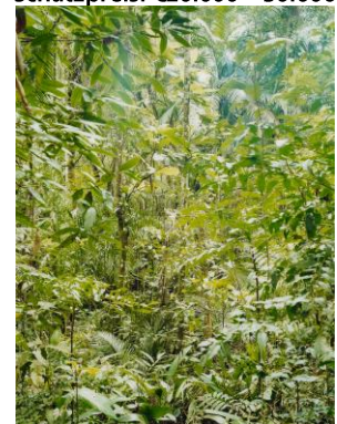
Thomas Struth (1954) "Paradise 22. Sao Francisco de Xavier/Brasil" | 2001 | 117 x 135,2cm Cibaprint | Ex. 8/10 Schätzpreis: €20.000 – 30.000