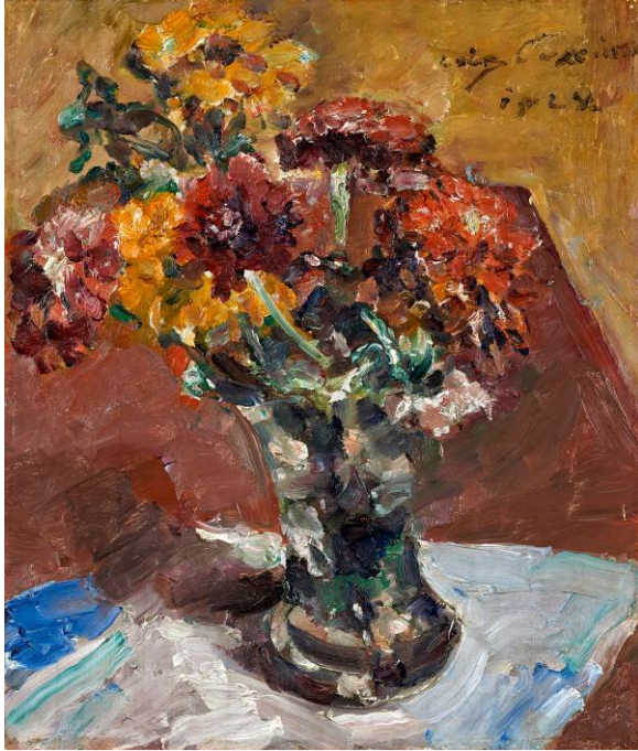
Lovis Corinth (1858 – 1925) Herbstblumen in Vase | 1924 | Öl auf Holz | 56 x 48cm Schätzpreis: 130.000 – 180.000 Euro

Highlights der Auktion „Modern“ aus der Sammlung Waffenschmidt am 30. Mai 2018