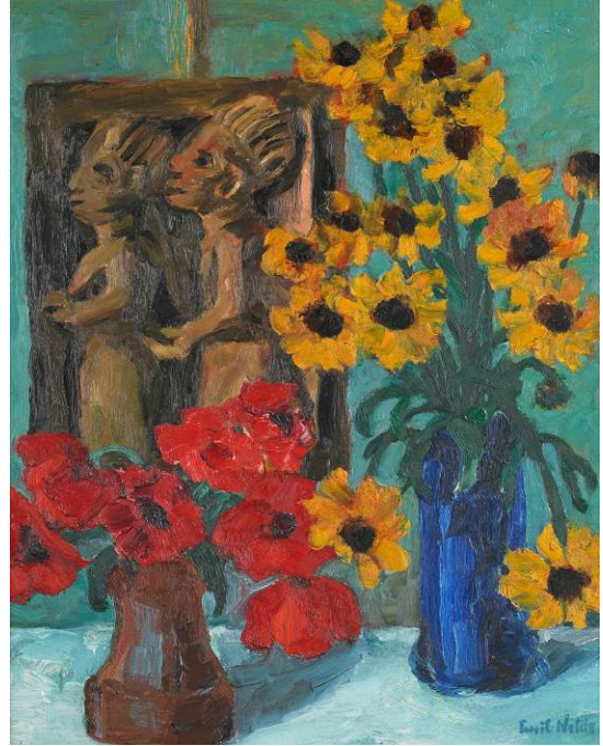
Emil Nolde (1867 – 1956) Holzplastik und Blumen | 1928 | Öl auf Holz | 88,5 x 73,5cm Schätzpreis: 500.000 – 800.000 Euro