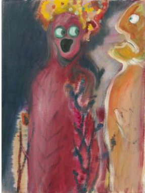
Daniel Richter (1960) Ohne Titel | 2001 Öl auf Leinwand | 40 x 30 cm Schätzpreis: €12.000 – 18.000