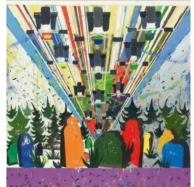
Tal R (1967) „Riders in the sky“ | 2001/02 Öl auf Leinwand | 250 x 250 cm Schätzpreis: €25.000 – 35.000